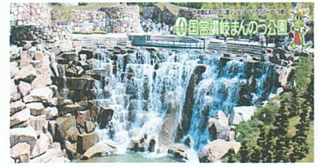
讃岐まんのう公園 & モンスターバスシュ