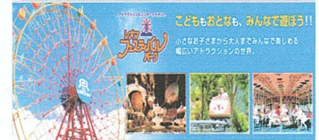
レオマワールド ウォーターランド