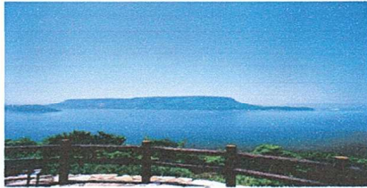
屋島・瀬戸内国際芸術祭