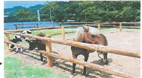
しおのえふじかわ牧場 (乳搾り、チーズ&ピザ作り体験)