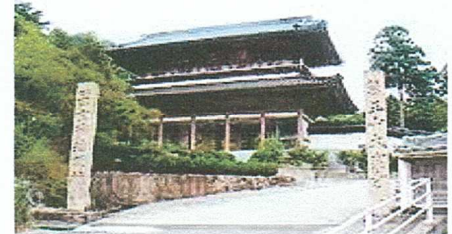
大窪寺(四国遍路88番結願寺)