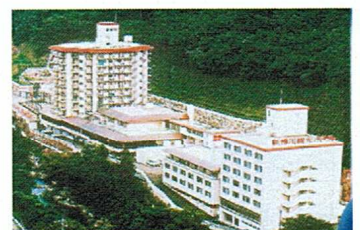
新榊川観光ホテル