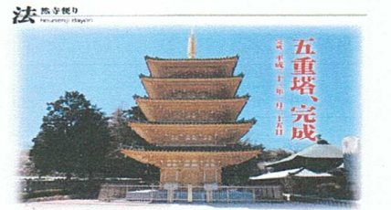
讃岐の寝釈迦!法然寺!