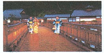
さぬきの奥座敷 塩江温泉郷