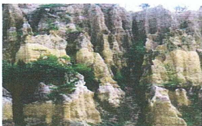
阿波の土柱(天然記念物)