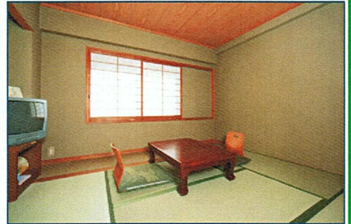
貸室のお部屋 (イメージ)