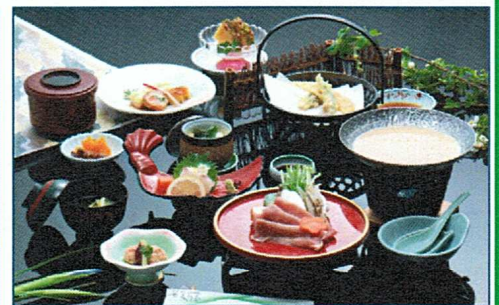
会席料理 (イメージ)

ご入浴・会席料理・貸室 (3時間) がセットになったお得なプランです。(2名以上) (写真の料理はイメージです。内容等は季節によって変更になる場合がございます。)